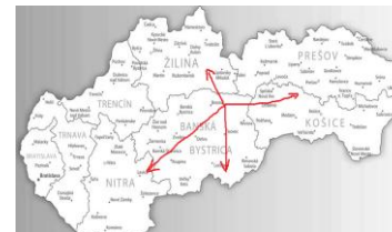
Rádius dovozu paliva